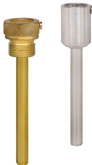
Рис. слева: гильза с резьбой

Благодаря наличию широкого ассортимента опций конструкций и материалов пользователь может подобрать оптимальный вариант гильзы для специальных условий применения. Выбор гильзы зависит от типа технологического соединения (фланцевое, резьбовое и стерильное соединение) и условий производственного процесса. Основные варианты конструкции представлены резьбовыми, приварными и фланцевыми гильзами.