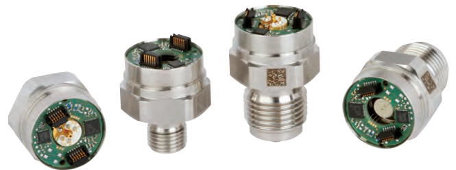
Примеры преобразователя давления модели TI-1

Преобразователь давления производится на современном оборудовании, что позволяет достичь максимальной гибкости и быстрого освоения новой продукции. Принцип изготовления обеспечивает непрерывное отслеживание каждой единицы продукции, включая уровень индивидуальных компонентов.